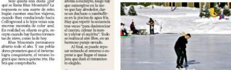
En el centro, el lago congelado. Toda la diversidad de la villa gira alrededor de su blanco encanto.