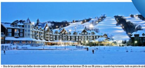
Una de las postales más bellas de esta centro de esquí: al anochecer se iluminan 25 de sus 38 pistas, y cuando hay tormenta, todo se pinta de azul.

En su nivel, recibirán Blue Mountain en un lugar completamente distinto. La villa es compacta, hace 50 años, no ha perdido ni un restaurante, ni un negocio de la zona. "No sólo había este restaurante. El hotel... el pueblo que se encuentra más cercano al resort. Y ahora hay un lugar hermoso al pie de la montaña", dice mientras mira hacia el lago en el centro de la villa en el que se puede patinar y jugar hockey durante el invierno.